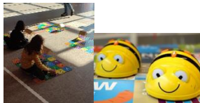
MINT- Projekt mit den Kitas

Gemeinsam mit dem Förderverein beteiligten wir uns an den beiden Familienfesten rund um das Schloss Ovelgönne. Das Tanzprojekt „Der Löwe in dir“, das Frühlingsingen der 4. Klassen in Verbindung mit dem Frühlingsfest der OGS, Klasse 2000 in allen Klassen finanziert durch den Lions Club, die Umweltentdeckertage, der Lesewettbewerb der Grundschulen und der Malwettbewerb der Volksbanken (bei beiden konnten wir erfolgreich Platzierungen belegen) - all das wurde erfolgreich durchgeführt. Wir fuhren mit allen 3.+4. Klassen in die Philharmonie. Die ersten Klassen begrüßten die künftigen Schukis der Kitas im Programmierworkshop mit den Beebots.