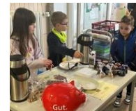
Spendenaktion für Erdbebenopfer

Die Schule erhielt wiederholt die Auszeichnung „klimaengagiert – Silber“ und gewann mit dem Umweltengagement den Umweltpreis der Stadt Bad Oeynhausen sowie ein Preisgeld, das wieder in neue Umweltprojekte geflossen ist – ein Projekttag der nun „alten“ Umweltbotschafter zum Klimaschutz für die zweiten und dritten Klassen.