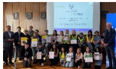
Umweltpreis der Stadt Bad Oeynhausen